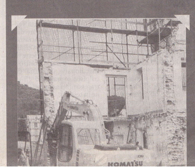
Dall'alto in basso: il cartello affisso su Villa Bernarda, a Spotorno, prima della vendita e demolizione. Villa Bernarda in una foto anni '20 quando era abitata dai coniugi Lawrence. I lavori di demolizione dell'edificio