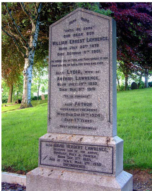
La tomba della famiglia Lawrence a Eastwood

Nel cimitero di Eastwood, immersa nel prato e contornata dagli alberi, si trova la tomba della famiglia Lawrence. Qui sono sepolti i genitori e il fratello dello scrittore. Nonostante vi sia un riferimento allo scrittore stesso, le sue ceneri furono sepolte a Vence, nella Francia del sud, e in seguito traslate a Taos, nel Nuovo Messico.